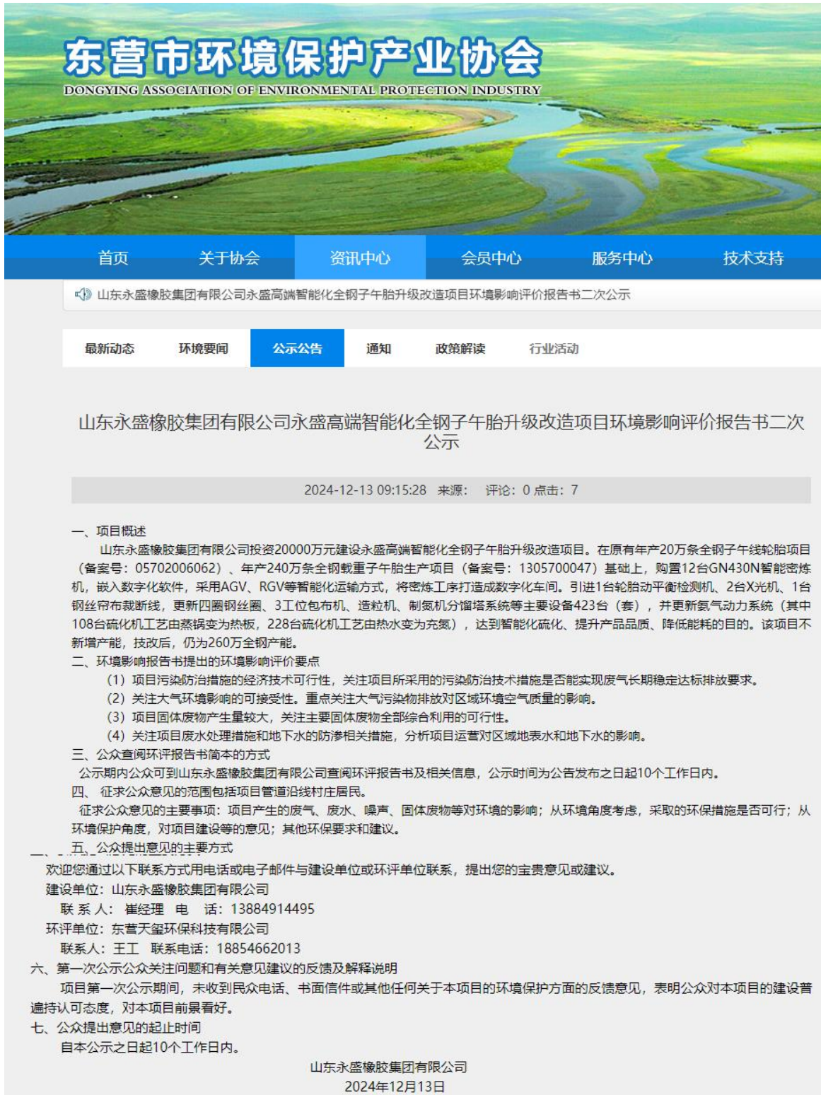
图2 第二次网络公示截图