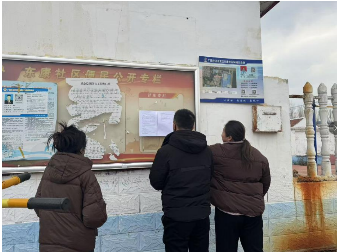
图6 东康村张贴公示情况