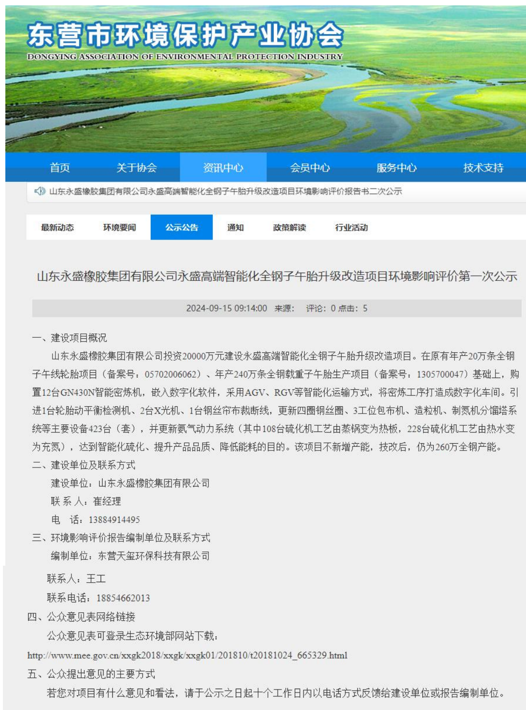
图1 环境影响评价一次网络公示截图

评价单位接受委托后于2024年9月15日在东营市环境保护产业协会官网（公示链接为： http://www.dyepi.org/index.php?a=show&catid=14&id=950 ）进行了第一次信息公示。公众参与一次网络公示截图见下图。