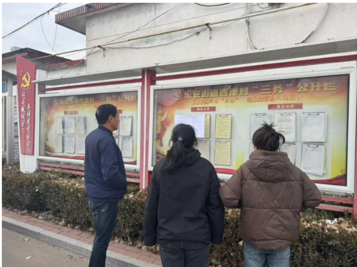
图5 西康村张贴公示情况

为进一步告知当地群众，加深其对项目的了解，在项目环境影响评价公众参与第二次公示（征求意见稿）期间，公示期为：2024年12月14日-12月27日，在项目周边2.5公里评价范围内各主要敏感目标张贴了项目的公示信息，张贴公示地点都是公众易于接触的场合，此次张贴公示区域选取符合《环境影响评价公众参与办法》的要求。